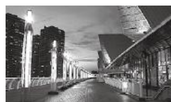
デイナイトカメラ