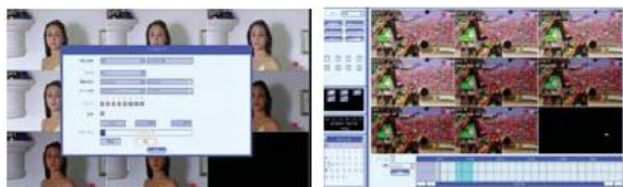
データバックアップ

USBにバックアップしたファイルをDVR本体から再生することができます。(パソコンからも再生可能)