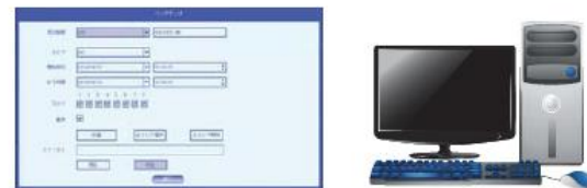
AVIファイルバックアップ

専用ビューアの他にAVIファイルでのバックアップが選択できます。(パソコンのみでの再生可能)