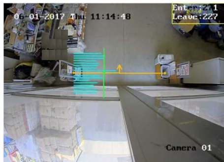
ライブビューカウント画面 (例) 指定したラインを通過した人数をカウント